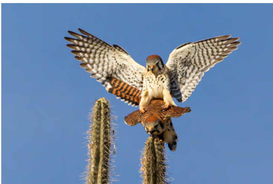
gigli en couple par Rebecca Field. Oiseau terrestre.