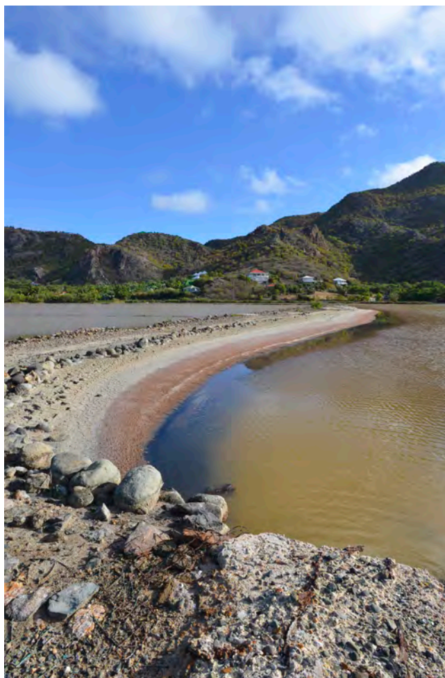
Salines, projet du Conservatoire du Littoral.

Gardez l'œil ouvert et appelez la Réserve Naturelle !