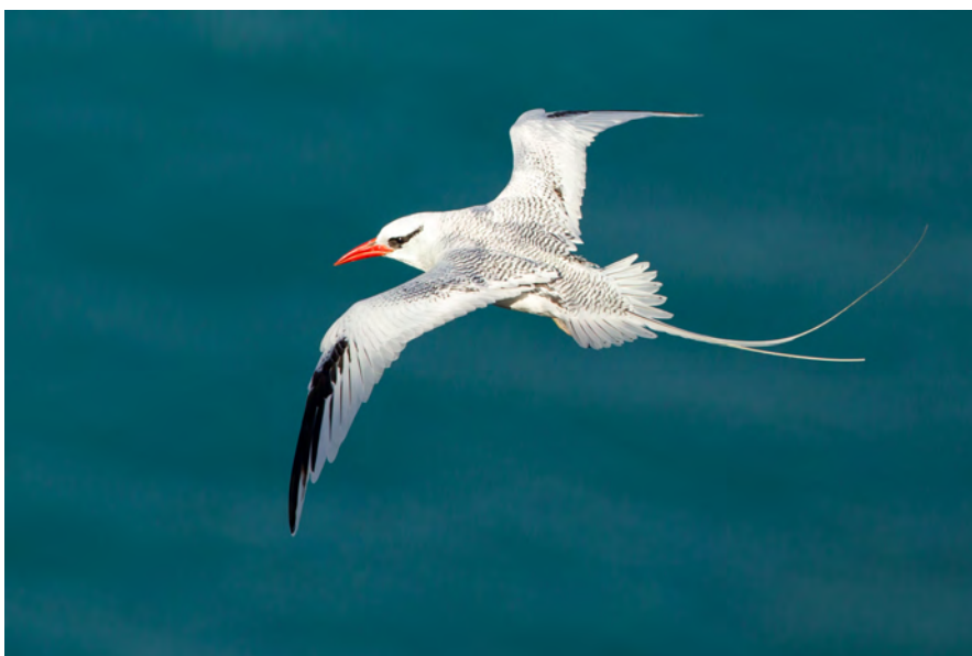
Paille en queue par Rebecca Field. Oiseau marin.