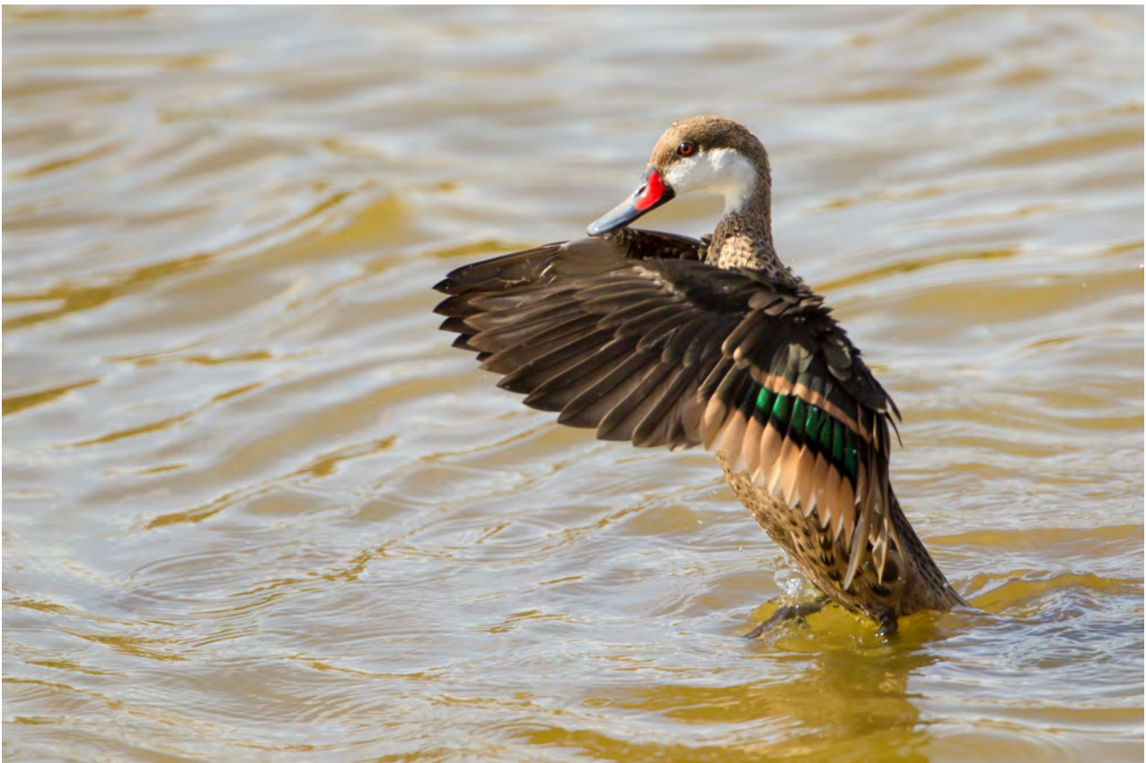
Canard des Bahamas à Petit Cul de Sac par Rebecca Field. Oiseau des étangs.

Souvent négligés, les oiseaux de St Barth sont des bio-indicateurs précieux et nous renseignent sur la qualité de notre environnement. La présence ou l'absence de certaines espèces nous indique la qualité des habitats et l'abondance des ressources, voir même par le passé l'état de santé du milieu. Par exemple la mortalité des pélicans en 2012 était symptomatique d'une dégradation de l'étang de St Jean. Ne pas voir d'oiseaux sur certains sites est alarmant, ou ne voir qu'une seule espèce doit susciter l'interrogation. La Réserve Naturelle effectue un suivi des oiseaux sur les étangs depuis 1999 et le constat est clair : Les effectifs diminuent de façon significative sur tous les étangs de l'île. A noter notamment la gestion artificielle récente des mises en eau des étangs, Petit Cul de Sac est aujourd'hui sec quand St Jean et Salines restent en eau. La protection et la valorisation de nos zones humides sont indispensables pour notre biodiversité, pour la qualité de notre environnement et la valorisation de notre territoire.