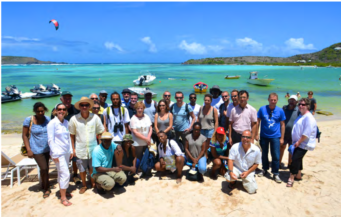
La délégation CRFA au lagon de Grand Cul de Sac.

Le Fort Carl, site du Conservatoire du Littoral géré par nos soins, vient de recevoir de nouveaux panneaux, tables d'orientations et plaquettes botaniques afin de tout comprendre sur les espèces locales, les paysages et l'histoire du site. Une belle balade en accès public, gratuite, au dessus du Collège Mireille Choisy.