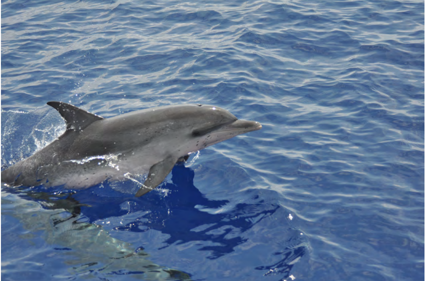
Dauphin tacheté de l'atlantique.