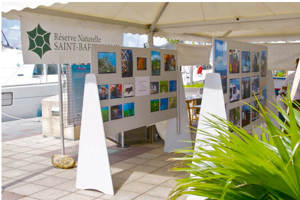
L'exposition de la Réserve Naturelle sur le quai.

Des délégations venant de Guyane, de Guadeloupe et de Martinique sont venues à St Barth afin de participer au colloque de la Fondation de Patrimoine dans le cadre de l'année de l'Outre-Mer. Etaient également présents des représentants des Réserves de Biosphère, des espaces naturels de la Guyane et du Brésil, des représentants de l'Etat et bien entendu de la COM de St Barthélemy. L'occasion pour la Réserve Naturelle de mettre en valeur la nature de St Barthélemy, son patrimoine et ses espaces protégés. L'équipe de la réserve qui a grandement participé à l'organisation de cet événement ont présenté une exposition, participé à un petit spectacle sur le patrimoine et surtout encadré des sorties sur le terrain en collaboration avec les clubs de plongée. Une belle semaine de rencontres et de sensibilisation.