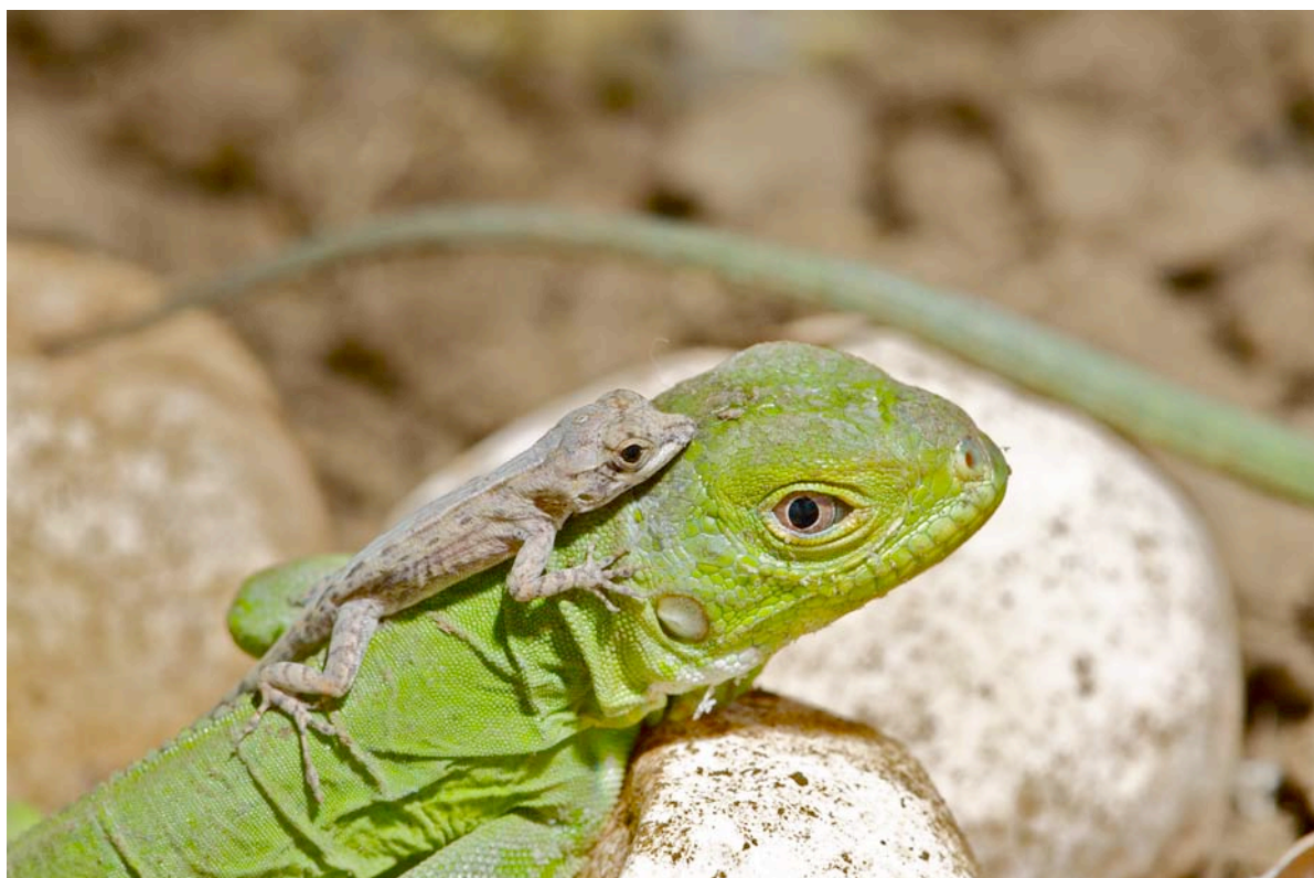
Un bébé anolis est né dans le même pot le même jour...décidément !