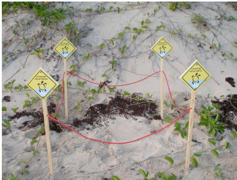
Attention, nid de tortue !

Des panneaux explicites sont mis en place pour protéger les nids de tortues marines. Ne pas marcher ou rouler (!) dessus et attention aux chiens qui creusent les nids et qui sont interdits sur les plages de St Barth depuis 1986 !