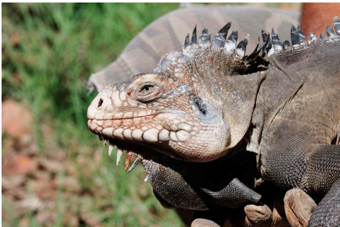
Palais abîmé mais cet iguane est costaud et rustique.