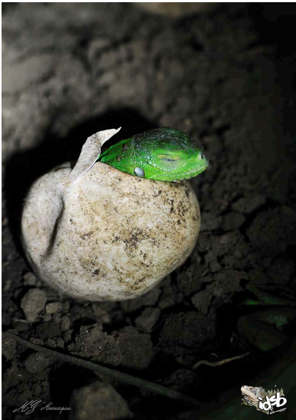
Bébé Iguana Delicatissima sortant de son œuf...